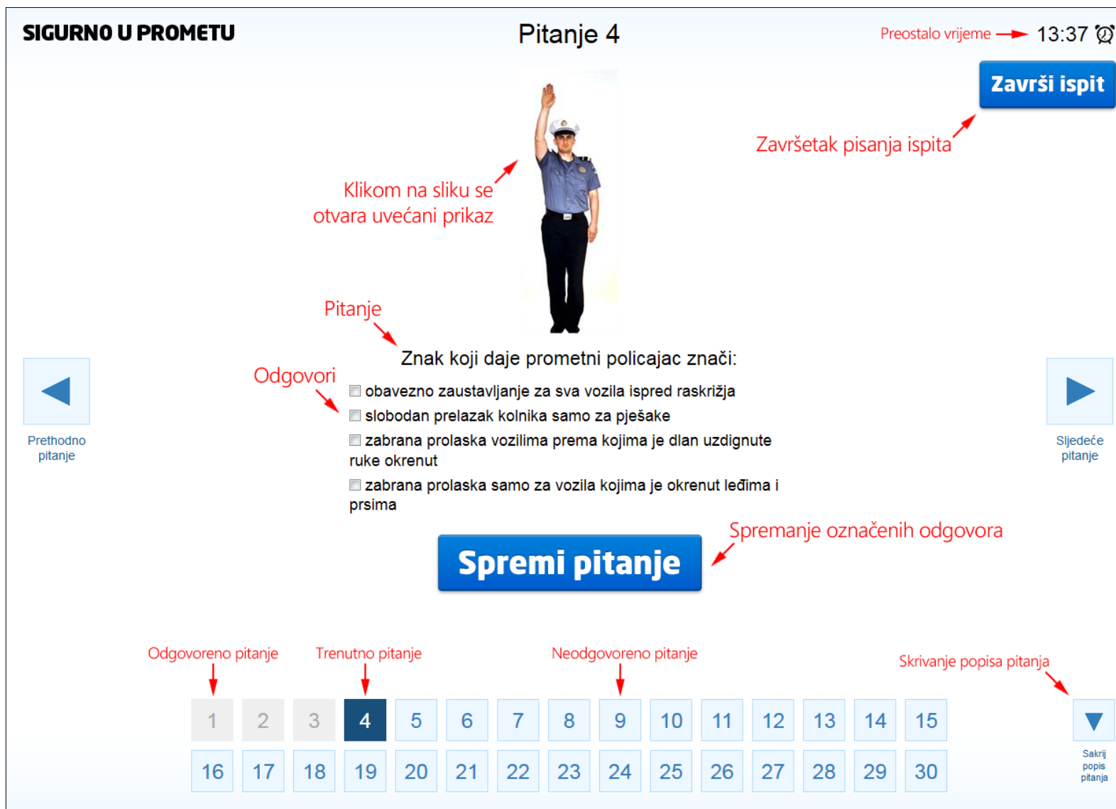
Slika 5. Ispitno sučelje